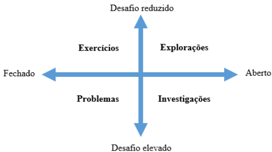
Figura 1 – Relação de diferentes tipos de tarefas, em função de suas dimensões de natureza e desafio

Tendo em vista estas duas dimensões, Ponte (2005) elabora um esquema, presente na Figura 1, no qual apresenta alguns tipos de tarefas e as classifica com base nestas duas dimensões, natureza e desafio, como eixos de um plano.